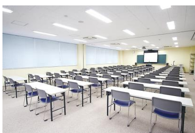
2号館多目的演習室